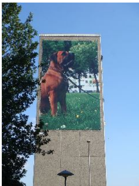
Домашният любимец върху стената на блока – изборът на