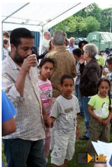
Жители на квартала в „дискусионната” тента