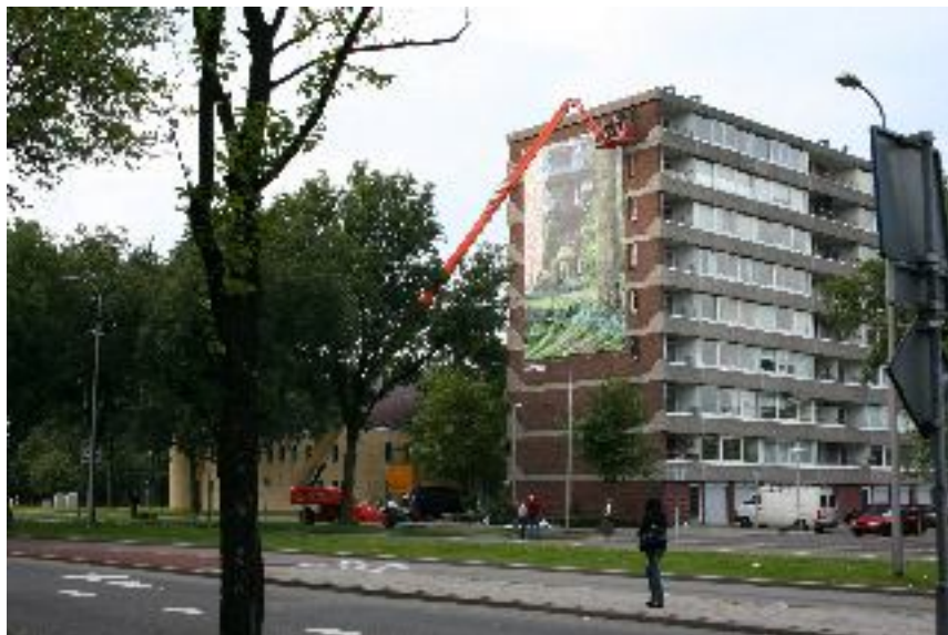
Момент от процеса на инсталиране на още едно пано

За контакти: Nelly van der Geest: nelly.vandergeest@central.hku.nl