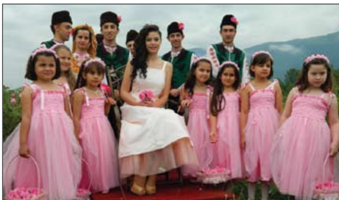
Тържествено откриване на Розобера и Розоваренето, Община Карлово