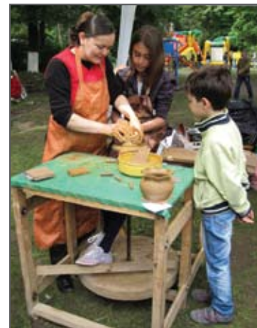
„Фестивал „Мостове към бъдещето“, Община Горна Оряховица