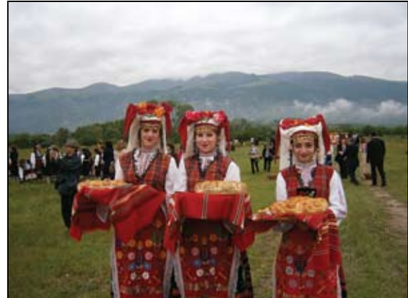
Тържествено откриване на Розобера и Розоваренето, Община Карлово