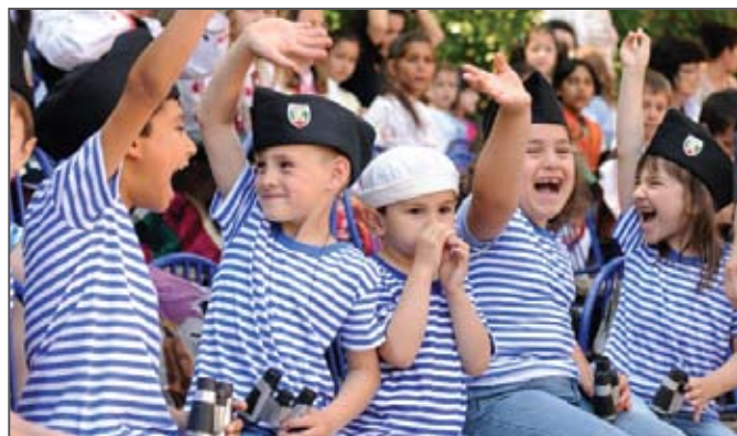
Фестивал „Созополис“, Община Созопол