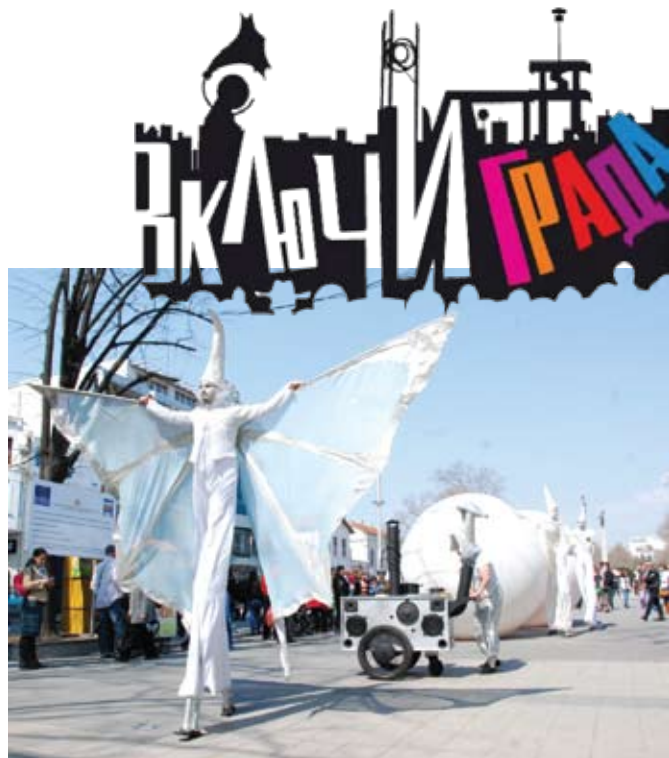
Фестивал „Включи града“, Община Бургас