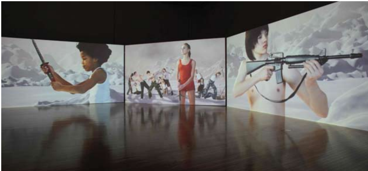
SOFIA CONTEMPORARY, Столична община

Максимален срок за изпълнение на договорите – 24 месеца.