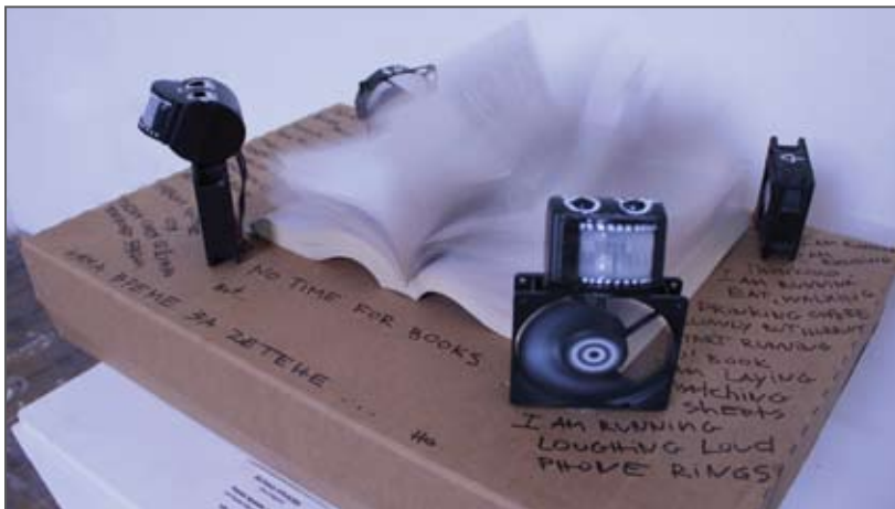
„Дигитални алтернативи в изкуството“, Община Варна

Концепцията за иновативно културно събитие не изключва възможността подобно събитие да се е случвало вече някъде в България, в региона, в ЕС, или някъде по света, но същественото в случая е, че събитието се развива върху специфичната местна културна почва и вдъхва нов живот на местните традиции, дори когато ги разчупва; отговаря на местните потребности, местния дух („културната екология“ на мястото) и води до създаването на „културна марка“ на целевата територия.