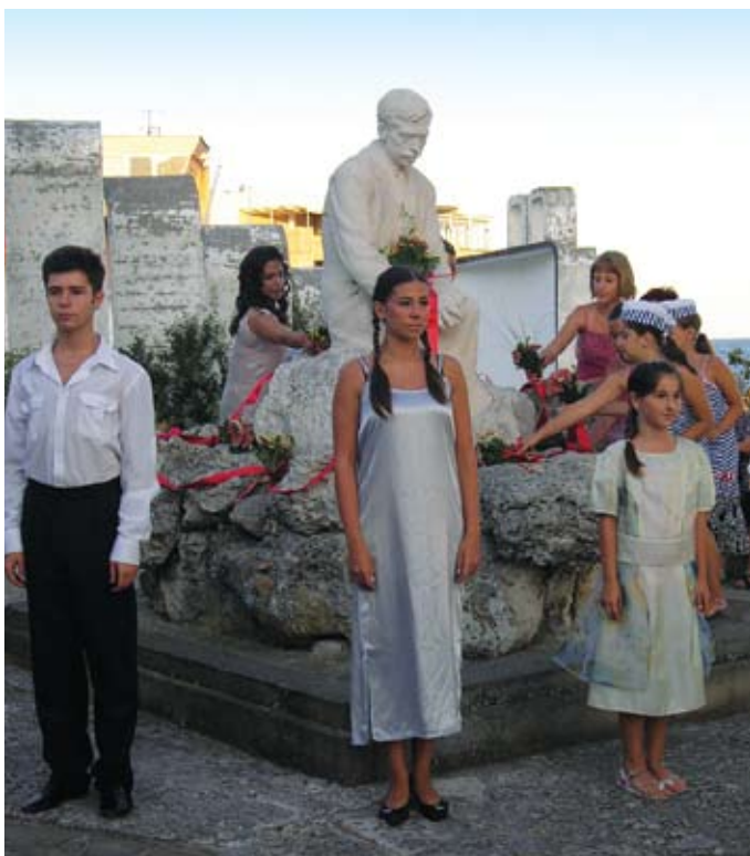
Фестивал „Палитра от изкуства“, Община Поморие