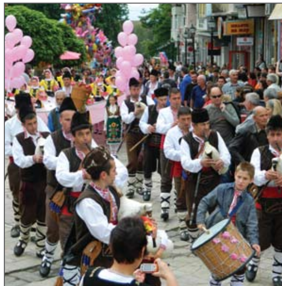
Тържествено откриване на Розобера и Розоваренето, Община Карлово