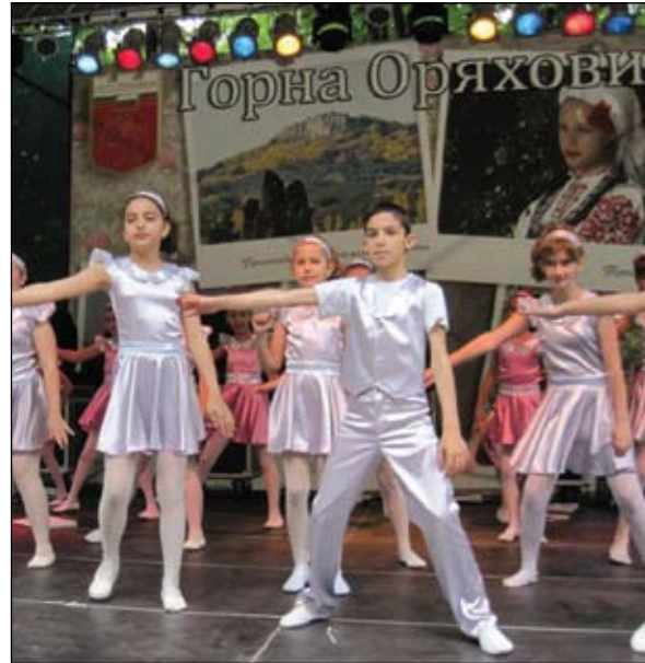
Фестивал „Мостове към бъдещето“, Община Горна Оряховица